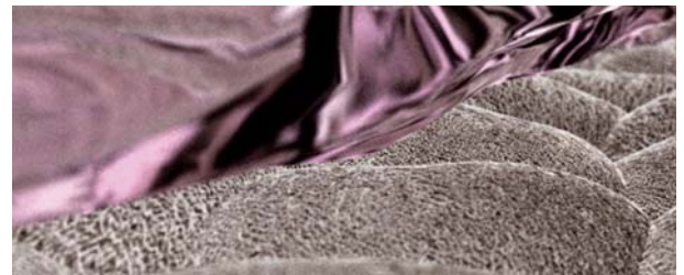
De siliconengel kleeflaag voorkomt elke vorm van weefselbeschadiging bij verwijderen van het kompres